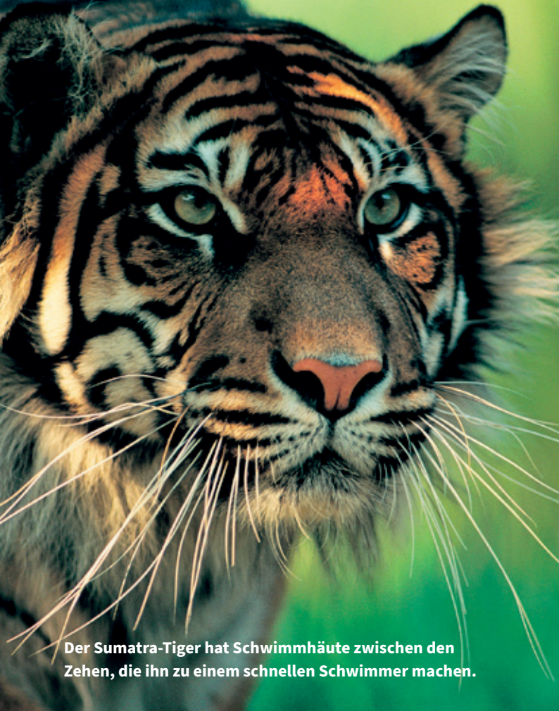
Der Sumatra-Tiger hat Schwimmhäute zwischen den Zehen, die ihn zu einem schnellen Schwimmer machen.