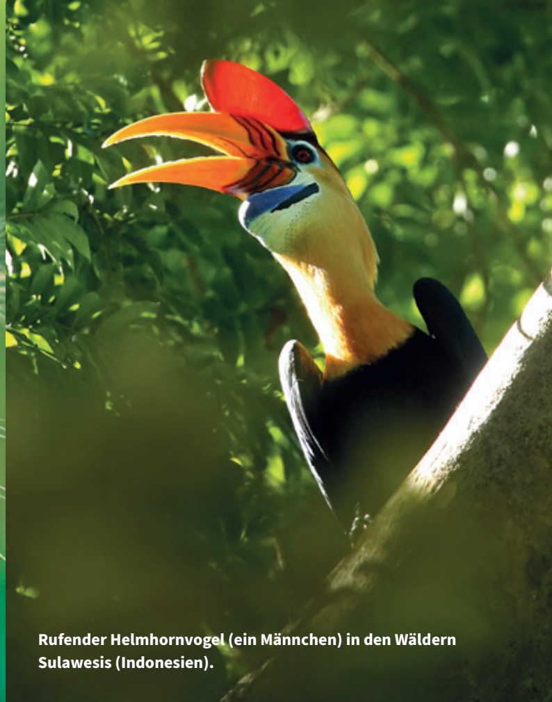
Rufender Helmhornvogel (ein Männchen) in den Wäldern Sulawesi (Indonesien).