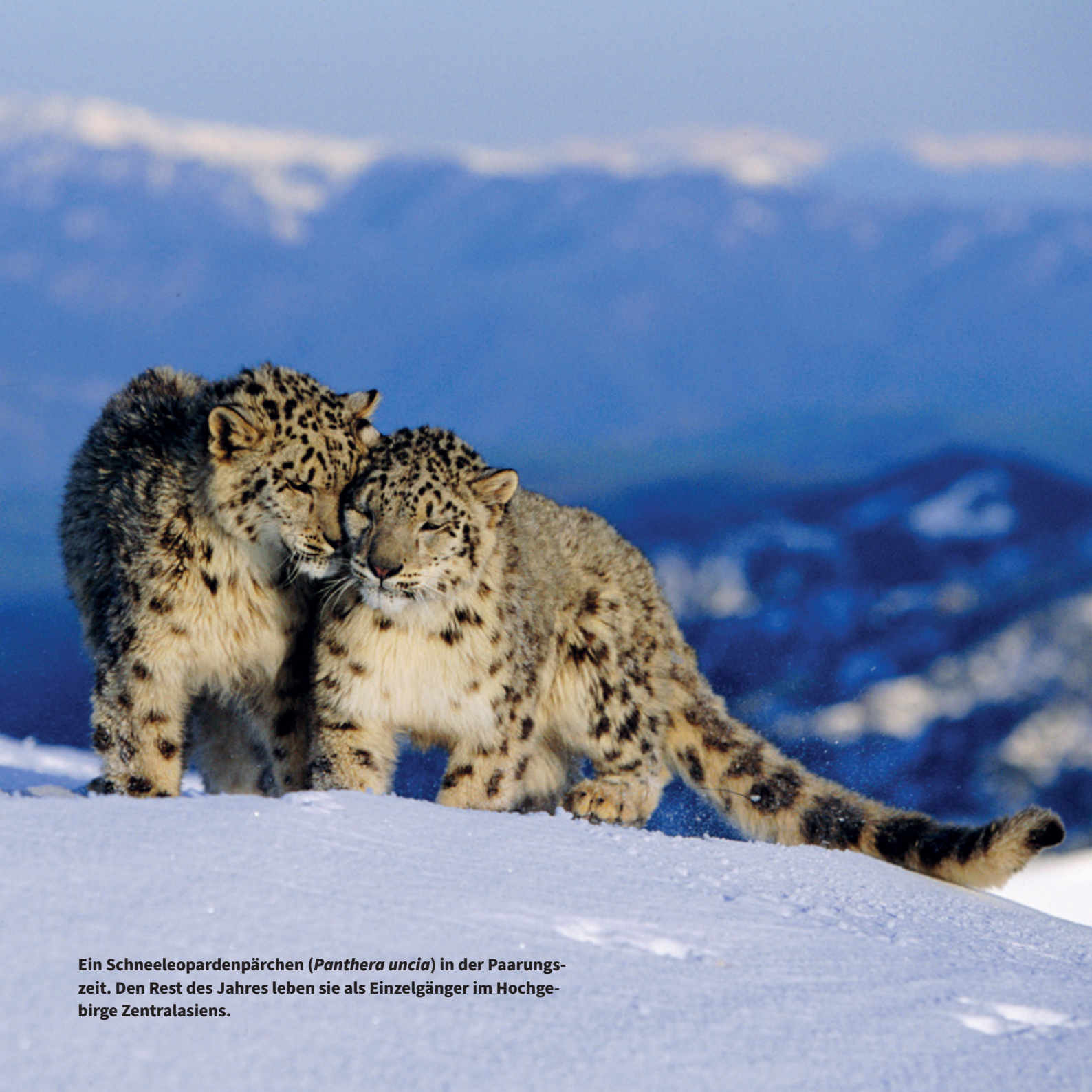
Ein Schneeleopardenpärchen ( Panthera uncia ) in der Paarungszeit. Den Rest des Jahres leben sie als Einzelgänger im Hochgebirge Zentralasiens.